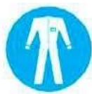
Protezione obbligatoria del corpo