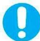
Obbligo generico (con eventuale cartello supplementare)