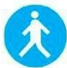
Passaggio obbligatorio per i pedoni