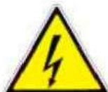
Tensione elettrica pericolosa