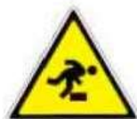
Pericolo di inciampo