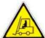
Carrelli di movimentazione