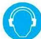
Protezione obbligatoria dell'udito