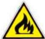
Materiale infiammabile o alta temperatura