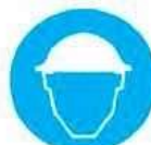
Casco di protezione obbligatoria