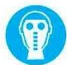
Protezione obbligatoria delle vie respiratorie