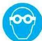
Protezione obbligatoria degli occhi