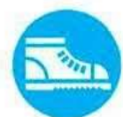
Calzatura di sicurezza obbligatoria