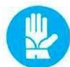
Guanti di protezione obbligatoria