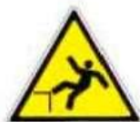
Caduta con dislivello