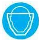
Protezione obbligatoria del viso